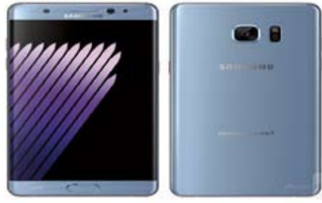
SAMSUNG Galaxy Note7

بطاريات هاتفها، والذي تسبب في سحبه من كل الأسواق العالمية، وخسائر مادية فادحة. وأوضحت قائلة إن نحو 700 مهندس فحصوا ما يقرب من 200 ألف جهاز و30 ألف بطارية؛ للوصول إلى السبب الحقيقي وراء انفجار البطاريات. وكانت "سامسونج" قد أعلنت في أكتوبر الماضي، إيقاف إنتاج "جلاكسي نوت 7" وسحبه من جميع الأسواق العالمية، بعدما تكبدت خسائر قدرت بـ3 مليارات دولار أمريكي.