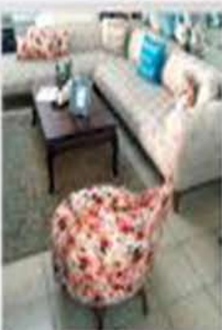
زاوية فخمة + كرسي هدية بدل 11,500 فقط 7,800