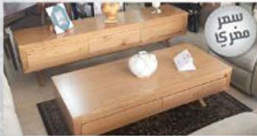
مزنون خشب "الون" قحطتين - سعر مغربي 3,400 فقط!