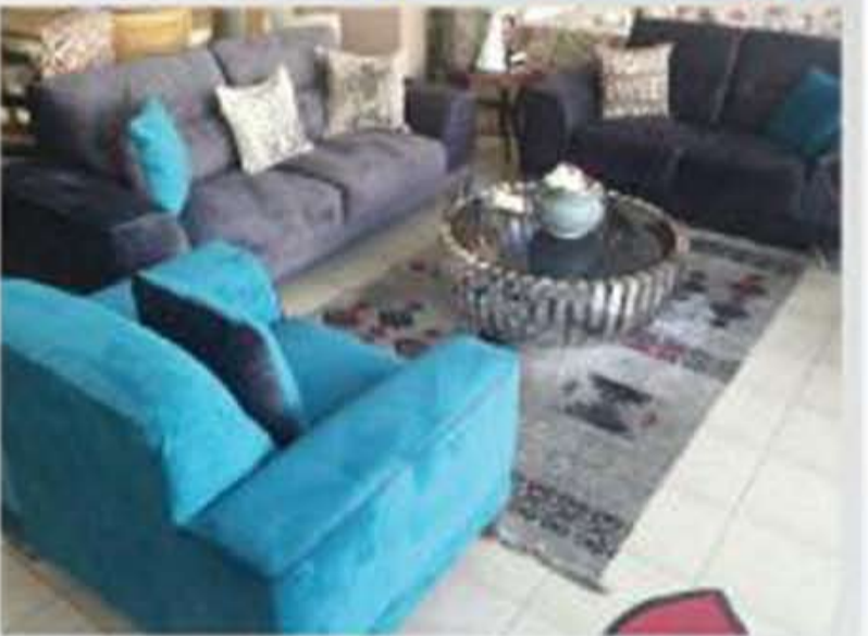
6 مقاعد ashley بدل 8,800 فقط! 6,400