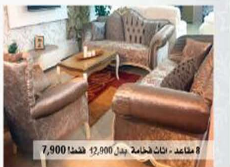
8 مقاعد - اثاث فخامة بدل 12,900 فقط! 7,900