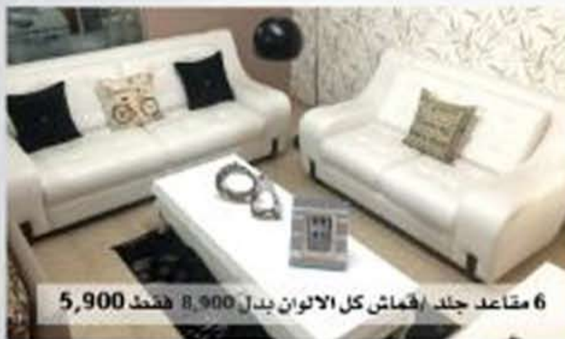
6 مقاعد جلد / قماش كل الالوان بدل 8,900 فقط 5,900

اثاث فخامة - استيراد مباشر من تركيا • اثاث هبية - استيراد مباشر من امريكا • اثاث صناعة محلية - رقي نصاميم والوان