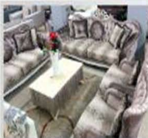
8 مقاعد - اثاث فخامة بدل 12,900 فقط 7,900